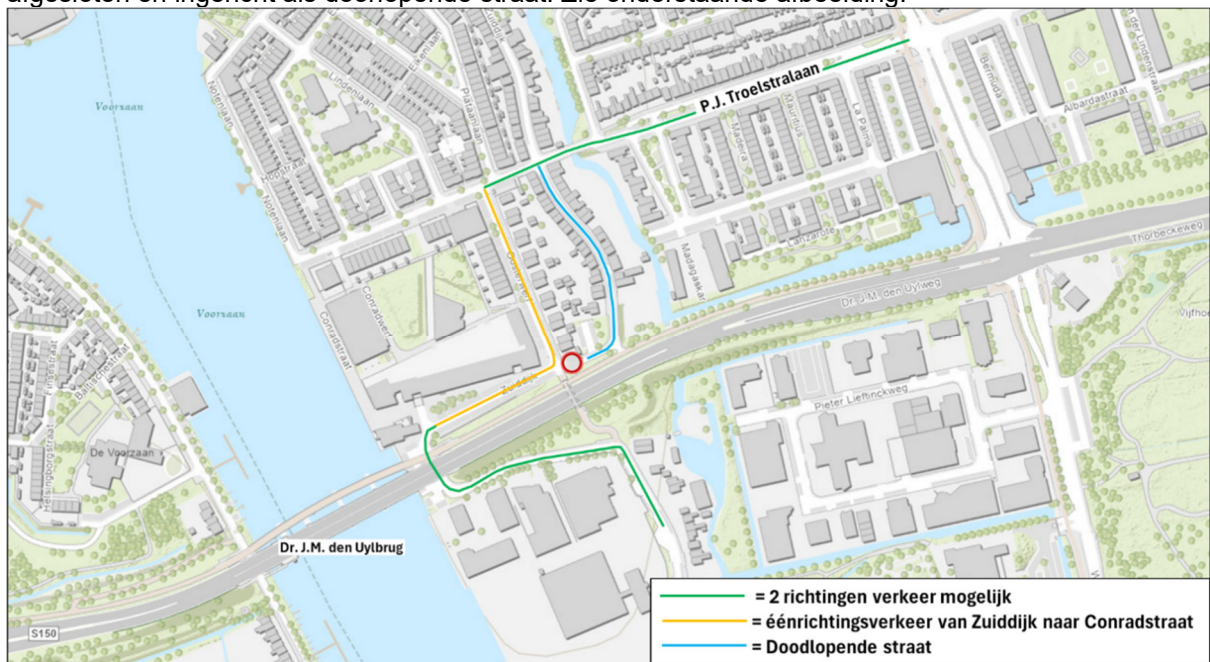
Afbeelding 2: Eénrichtingsverkeer auto's

Op de Zuidzijde wordt éénrichtingsverkeer ingesteld om de doorgang te borgen. U kunt tijdens de werkzaamheden alleen vanaf de zuidzijde Zuidzijde via Oosterwerf naar de Conradstraat/P.J. Troelstraan rijden. Het gedeelte van de Zuidzijde dat nu éénrichtingsverkeer is, wordt bij de fietstunnel afgesloten en ingericht als doorlopende straat. Zie onderstaande afbeelding.