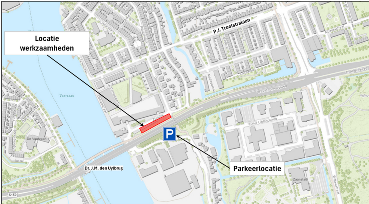
Afbeelding 1: Locatie werkzaamheden Zuidzijde en alternatieve parkeerlocatie

Let op: Vanaf 6 januari 07:00 uur dient de parkeerplaats autovrij te zijn en is er een wegsleepregeling van kracht.